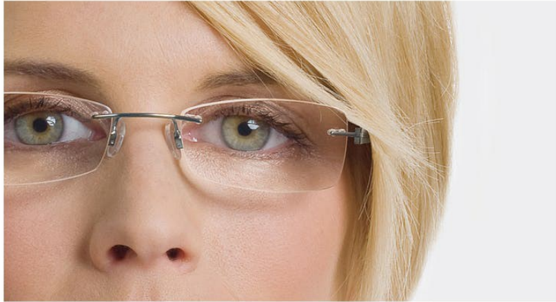
不受人喜欢的goole眼部效果

这样会使你的眼睛看起来小一些。在敷涂任何东西时都要非常小心，因为镜片的放大作用会使得化妆瑕疵更加明显。不要在上方使用太多的睫毛膏，在下方使用很少量或者不是用睫毛膏。