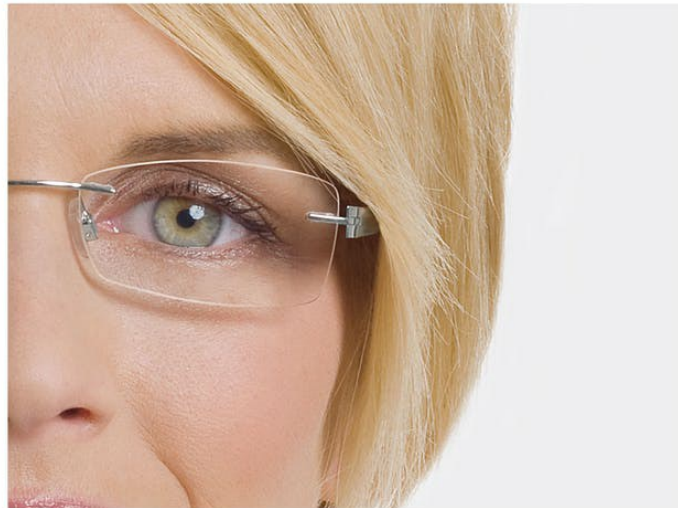
不受人喜欢的缩小效果

近视的女性，配戴眼镜面临着截然相反的问题。但是不幸的是，他们的眼镜使得眼睛看起来变小。因此，近视女性需要避免黑色的眼影和厚的眼线。选择鲜艳的以及闪亮的颜色比如玫瑰红，淡紫色，米色，浅灰或者白色的眼影。