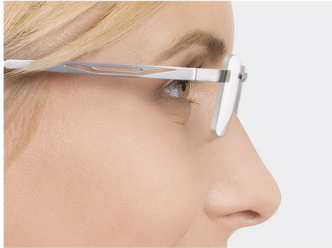
现代高折射材料得到小框架眼镜

当然，你也可以做些事情来确认你的眼镜不要太厚。现代 > (高折射材料) 可以使需要高度数处方眼镜的女性获得更加时尚的镜片，保持非常自然的外观。